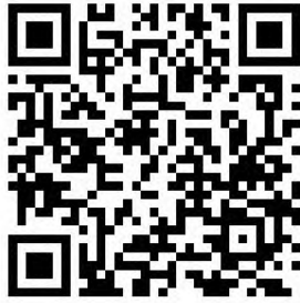
Фото и видео доступны по ссылке: cloud.mail.ru/public/vBHB/aBVMTotXM